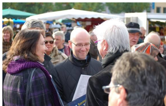
Dr. Peter Tauber im Gespräch auf dem Hanauer Marktplatz.

Dr. Peter Tauber und sein Team haben „Danke“ für das hervorragende Wahlergebnis gesagt. In Hanau verteilte das Team Tauber Postkarten, die mit einer kleinen Schokolade beklebt waren. „Ich bin nicht nur vor der Wahl, sondern auch danach immer ansprechbar und direkt bei den Menschen,“ erklärt Peter Tauber den Hintergrund der Aktion.