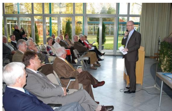
Dr. Peter Tauber während seines Vortrags in Bad Soden.