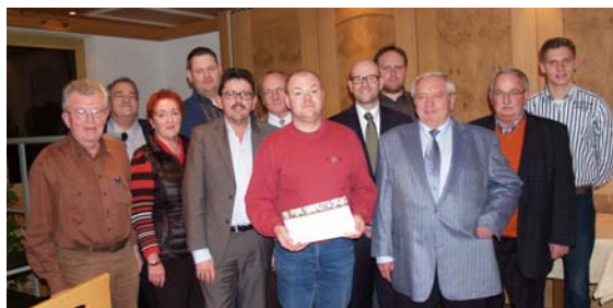
Tauber mit den Freunden der CDU Schlüchtern.

Vergangene Woche besuchte Peter Tauber die Jahreshauptversammlung des CDU Verbandes Schlüchtern, um dort gemeinsam mit den Mitgliedern den Vorstandswahlen beizuwohnen.