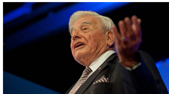
Prof. Dr. Schwarz-Schilling.

In seinem neusten Blogbeitrag schreibt Peter Tauber über Bundesminister a.D. Prof. Dr. Christian Schwarz-Schilling, welcher vergangene Woche eine Rede in Berlin hielt. Den Blog finden Sie unter der nachfolgenden Verlinkung: http://Cutin.de/ZJ8