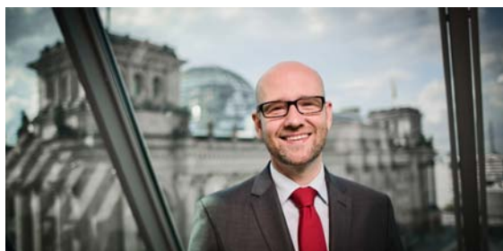
Tauber in Berlin.

In der Rubrik „Taubers Link der Woche“ verweist der Bundestagsabgeordnete auf verschiedene Verlinkungen rund um politische Themen. In dieser Woche stellt Ihnen Peter Tauber einen Artikel von „zeit.de“ vor, welcher sich mit der Thematik Netzpolitik beschäftigt. Die Verlinkung zum „Link der Woche“ finden Sie hier: http://Cutin.de/3h1