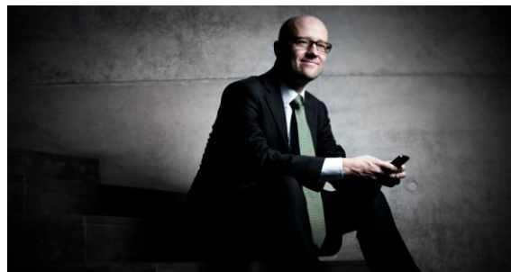
Vom „Jungen Wilden“ zum Hoffnungsträger.

„Gerade war er noch der junge Wilde der CDU. Jetzt ist Peter Tauber Generalsekretär. Weil er gern Wörter wie ‚Vaterland‘ und ‚Patriotismus‘ benutzt? Oder weil er trotzdem ein Mann für die Zukunft ist: Generation Twitter, Sympathisant von Schwarz-Grün?“, fragt der „Tagesspiegel“ in einem Porträt über den neuen CDU-Generalsekretär.