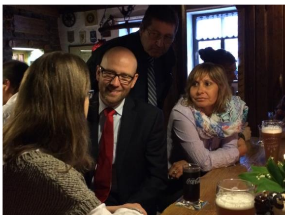
Peter Tauber im Gespräch mit Vereinsvertretern in der Hofreite Adam.

Am Abend klang der Tag mit einem Abendessen in der Hofreite Adam aus. Peter Tauber stellte das Thema ärztliche Versorgung im ländlichen Raum sowie den Breitbandausbau in den Mittelpunkt seiner kurzen Begrüßungsansprache. Anschließend nutzte der Abgeordnete die Gelegenheit, um mit den einzelnen Gruppen, darunter Vertreter des örtlichen Jugendclubs, des Schwimmbadvereins Einartshausen sowie aus dem Bereich der Ärzteschaft und der Pflegedienste, ins Gespräch zu kommen. Tauber versprach, sich den kleineren und größeren Problemen anzunehmen.