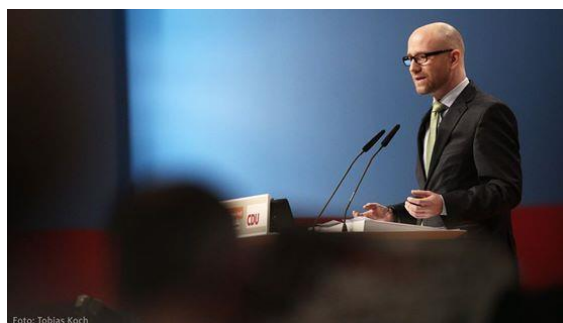
Peter Tauber sprach zu den Delegierten.

„Wir arbeiten für Deutschlands Zukunft. Dafür kommt es darauf an, dass wir es schaffen, die digitale Welt und die traditionelle Wirtschaft zu verschmelzen. Es waren christdemokratische Werte, die dieses Land zu dem gemacht haben, was es ist. Und auch heute brauchen wir kluge Köpfe, die Antworten auf die Herausforderungen von heute finden“, betonte CDU-Generalsekretär Peter Tauber in seiner Rede auf dem Bundesparteitag seiner Partei. Und weiter: „Diese Bundesrepublik ist ein Glücksfall für unser Volk. Wir als Christdemokraten sind stolz darauf, daran maßgeblich mitgearbeitet zu haben. Die Erfolge kann man ganz aktuell sehen.“