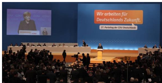
Angela Merkel spricht beim Bundesparteitag der CDU in Köln.

Ausführliche Informationen zum CDU-Parteitag, inklusive vieler Reden, Anträge sowie zahlreicher Videobeiträge finden Sie unter http://www.koeln2014.cdu.de/ .