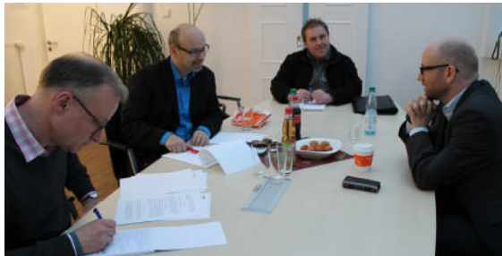
Peter Tauber zog vor Vertretern der heimischen Lokalzeitungen eine Bilanz seines ersten Jahres als CDU-Generalsekretär.

Im Gespräch mit Pressevertretern seines Wahlkreises – Gelnhäuser Tageblatt, Gelnhäuser Neue Zeitung und Kinzigtal Nachrichten – zog Peter Tauber eine Bilanz seines ersten Jahres als CDU-Generalsekretär. Aber auch lokale Fragestellungen aus seiner Arbeit als direkt gewählter Bundestagsabgeordneter kamen natürlich nicht zu kurz. Am Rande des Pressegesprächs verriet Tauber unter anderem, dass im März eine ganz besondere Herausforderung auf ihn wartet: Dann wird er als Gast in der ZDF-Satiresendung „heute-show“ zu Gast sein.