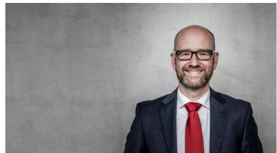
CDU-Generalsekretär Peter Tauber machte deutlich, dass auf die Verhandlungspartner große Verantwortung zukommt.

Das komplette Interview können Sie hier ansehen: https://tinyurl.com/y9dzxfbd