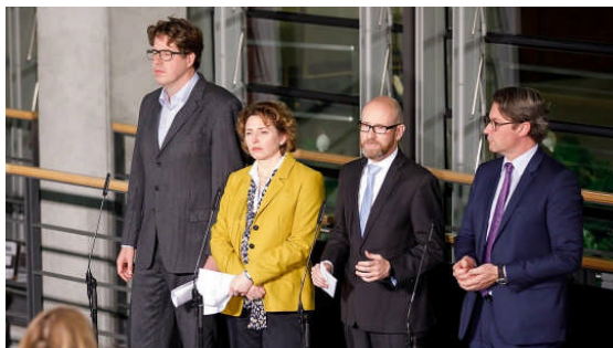
Die Generalsekretäre stellen sich den Fragen der wartenden Journalisten.

Das Thema Sicherheit stand in dieser Woche u.a. im Mittelpunkt der Sondierungsverhandlungen zwischen CDU, CSU, FDP und Grünen. In einem gemeinsam erarbeiteten