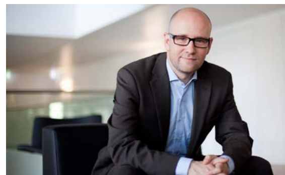
Wirbt für das "Ausbildungs-Ass": Peter Tauber.

Gemeinsam mit den Wirtschaftsjunioren Deutschlands zeichnen die Junioren des Handwerks die engagiertesten Ausbilder in den Unternehmen sowie herausragende Initiativen und Schulen aus, die Jugendliche besonders auf den Arbeitsalltag vorbereiten. Zu einer Beteiligung an dieser Initiative ruft Peter Tauber auf.