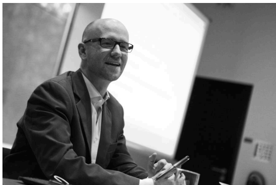
Peter Tauber bei seiner Stellungnahme.

„Das Verfassungsgericht hat der Bundesregierung einen klaren Auftrag erteilt. Die CDU/CSU-Bundestagsfraktion geht davon aus, dass das Bundesministerium für Arbeit und Soziales umgehend einen entsprechenden Gesetzesvorschlag erarbeiten und die geforderten Sofortmaßnahmen umsetzen wird.“