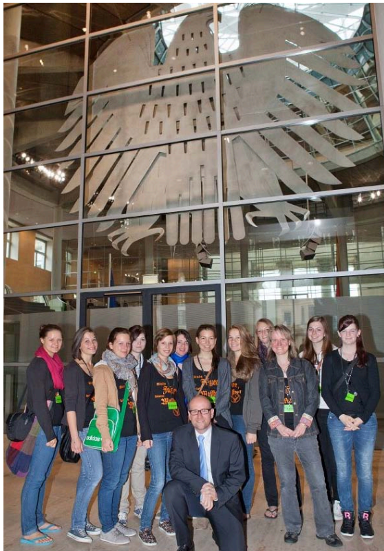
Peter Tauber mit dem Kurs der 12. Stufe.

Vor kurzem besuchte den Bundestagsabgeordneten Peter Tauber ein Kurs der 12. Jahrgangsstufe des Grimmelshausen-Gymnasiums aus Gelnhausen, um sich über die Arbeit eines Abgeordneten in Berlin zu informieren. Die Schülerinnen hatten sichtlich Spaß, als Tauber ihnen nach einem netten und informativen Gespräch einen Einblick in das Reichstagsgebäude inklusive dem Ausblick von der Kuppel über die Dächer Berlins ermöglichte. Das Bild zeigt den Kurs mit Peter Tauber auf der Rückseite vor dem von Norman Forster gestalteten Alder.