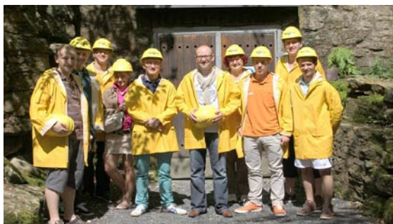
Peter Taubers Team.