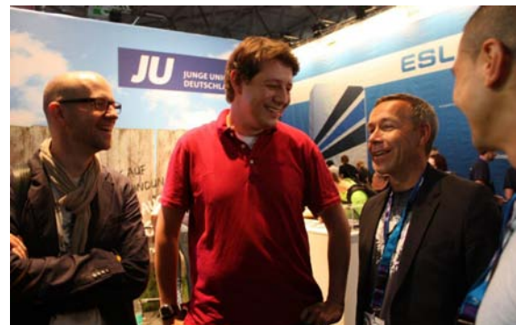
Peter Tauber auf der Gamescom.