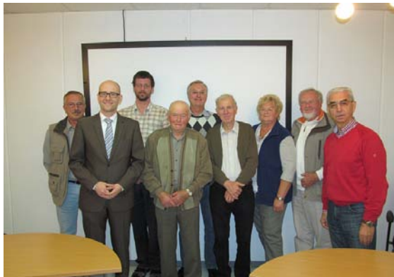
Tauber in Limeshain.