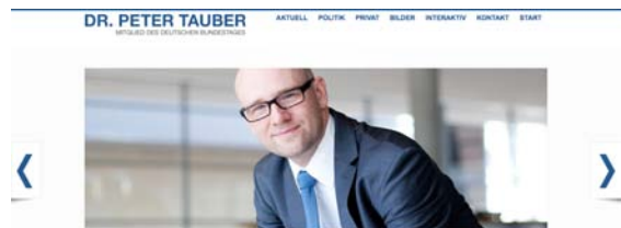
Peter Taubers neue Homepage.