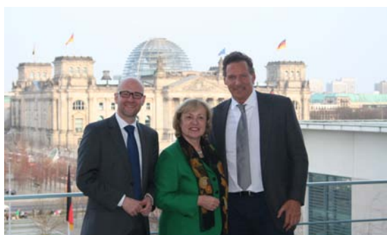
Peter Tauber hatte intensive Gespräche in Berlin.

Vergangene Woche traf sich Peter Tauber mit Staatsministerin Prof. Maria Böhmer und Schauspieler Ralf Möller, dem "Gladiator" im Bundeskanzleramt, um über Projekte zum Thema Integration zu sprechen.