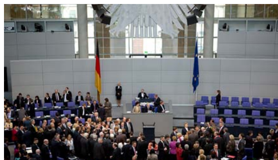
Der Deutsche Bundestag.