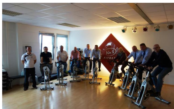
Tauber radelte mit!