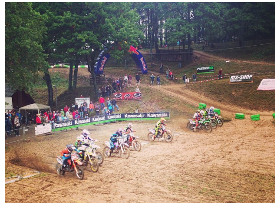
Beim MC Kassel/Spessart.